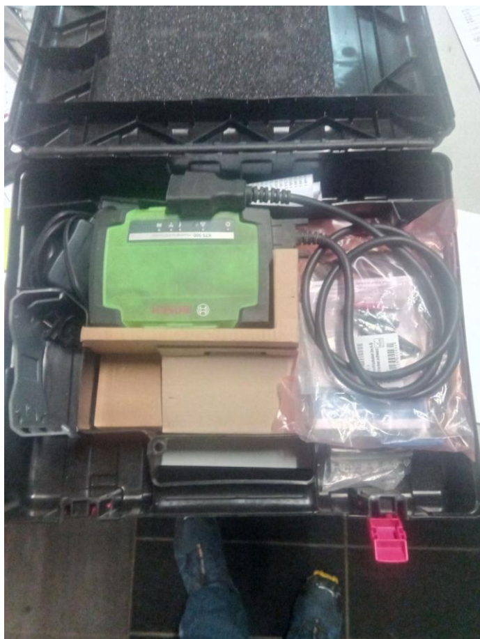
2. TESTER za dijagnostiku grešaka