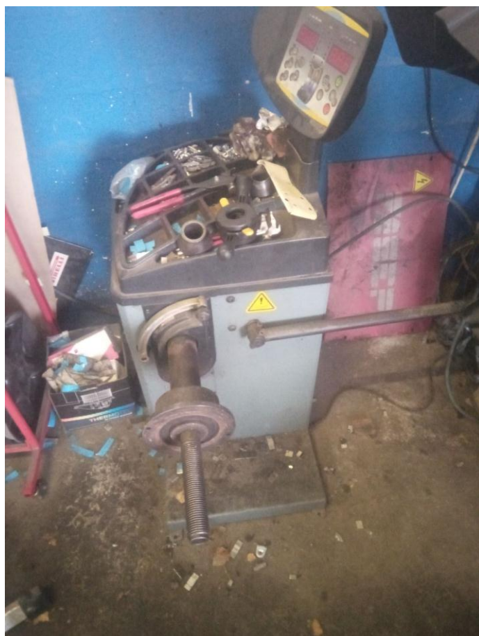
4. UREDAJ za balansiranje guma, m. Evertc 66