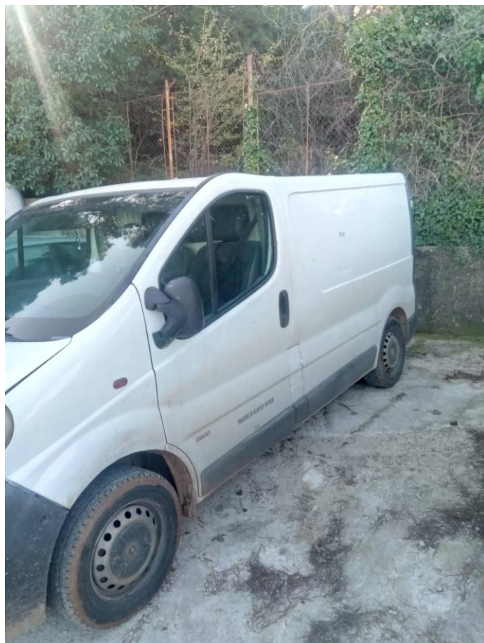
1. KOMBI VOZILO, m. OPEL, tip. VIVARO, mod. 1.9 DI, nrgo. PU-328-JI